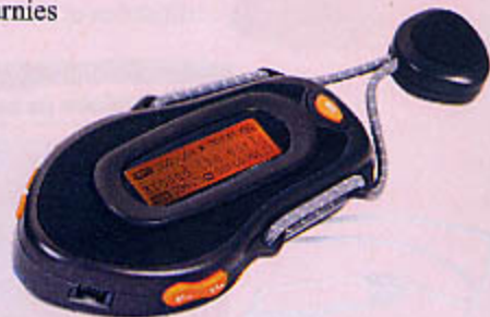
1200 LECTEUR MP3/IMAGE ET SON Baladeur MP3, dictaphone, normes audio numériques MP3 et WMA, 7 couleurs d'écran, ID3Tag, égalizer 6 D. Écouteurs stéréo haute fidélité, USB 2.0, fonctionne sous Windows 2000, XP, Vista et Mac OS 9.1