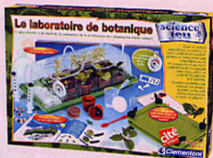
0854 LABORATOIRE DE BOTANIQUE Grâce à ce kit complet, l'enfant apprendra comment naissent, se développent les plantes au fil des saisons et climats. À l'aide d'une véritable presse, il pourra également réaliser son herbier