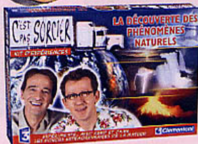
0914 C'EST PAS SORCIER PHÉNOMÈNES NATURELS Un coffret emmène les enfants à la découverte des phénomènes naturels : à l'aide de fiches illustrées et de sympathiques expériences.