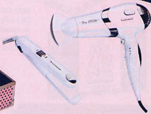
1121 COFFRET SÈCHE-CHEVEUX + LISSEUR lissage rapide, sèche-cheveux 2 vitesses, 2 températures, air froid direct et volumisateur