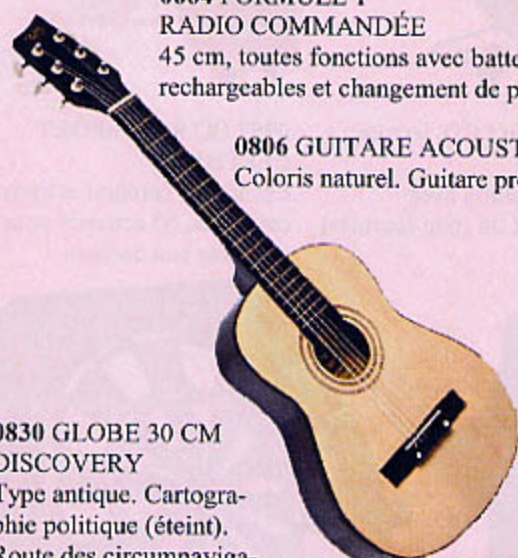
0806 GUITARE ACOUSTIQUE 70 CM Coloris naturel. Guitare professionnelle