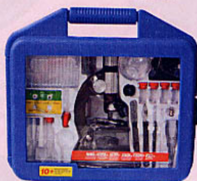
0828 MALLETTE MICROSCOPE Mallette microscope 73 pièces. Microscope e 25 cm, 3 grossissements. 2 piles LR 06 non fournies