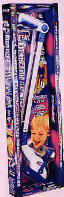
0978 DÉTECTEUR DE MÉTAL AVEC LUMIÈRE