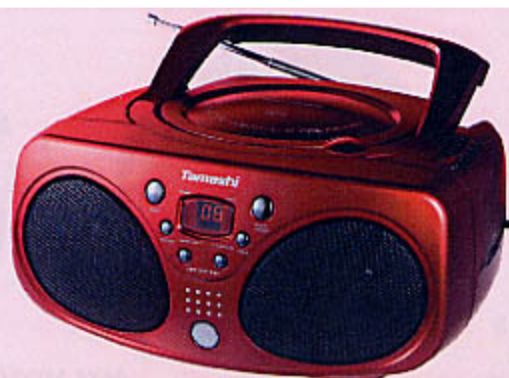
1272 RADIO STÉRÉO LECTEUR CD ROUGE Compatible CD-R et CD-RW, tuner analogique, 2 gammes d'ondes PO/FM, prise casque stéréo. Alimentation sur secteur