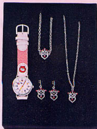
1113 COFFRET Montre + bijoux coeurs roses