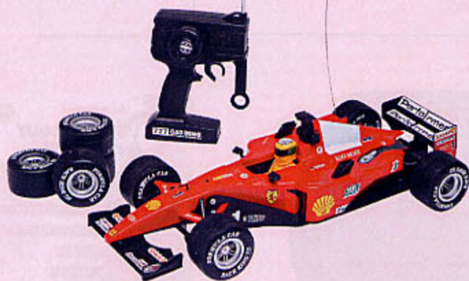
0664 FORMULE 1 RADIO COMMANDÉE 45 cm, toutes fonctions avec batteries rechargeables et changement de pneumatique.