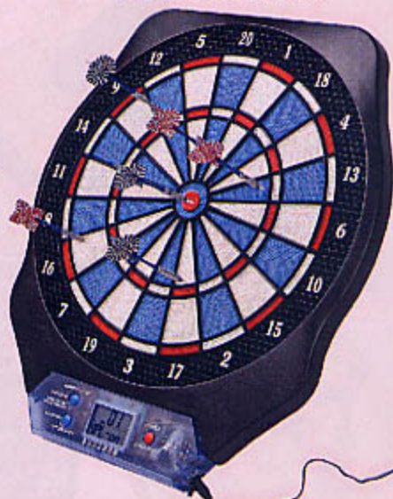
1074 CIBLE ÉLECTRONIQUE Avec adaptateur AC/DC. Livré avec 6 flèches. Possibilité 21 jeux. Effets sonores. Dim. 52 x 45 cm. Fonctionne aussi à piles 3 R 6 non fournies