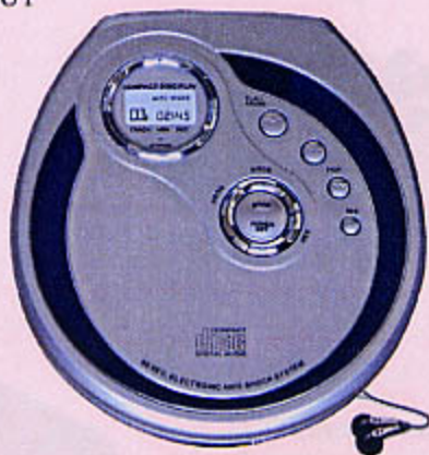
1180 BALADEUR CD ANTICHOCS Lecteur de CD, CD-R, CD-RW, écran LCD, lecture programmable, antichoc 60 s. Livré avec écouteurs stéréo. Alimentation avec adaptateur (non fourni) ou 2 piles LR 06 (non fournies).