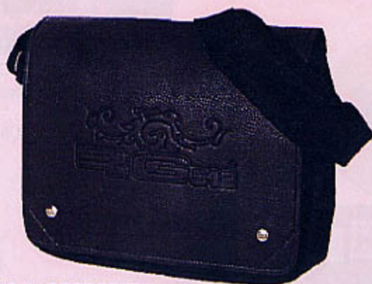
1102 SAC REPORTER NOIR RG512 Hauteur 30 cm, longueur 40 cm.