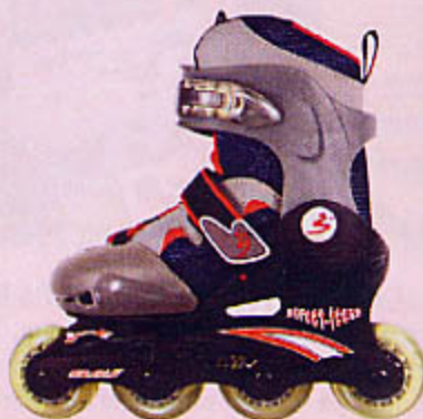
1014 ROLLER EN LIGNE Chassis plastique. Pointure : 32-35. ou 1015 ROLLER EN LIGNE Chassis plastique. Pointure : 36-39.