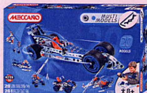
0794 MECCANO MULTI MODELS 20 modèles. 261 pièces. 2 piles LR 06 non fournies