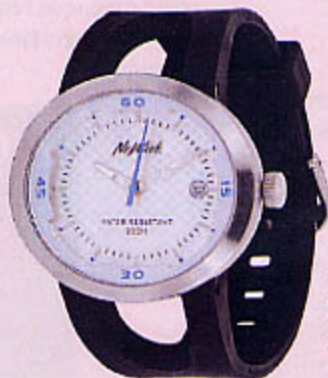
1128 MONTRE SPORT Résistant à l'eau.