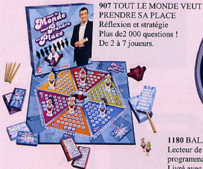
907 TOUT LE MONDE VEUT PRENDRE SA PLACE Réflexion et stratégie Plus de 2 000 questions ! De 2 à 7 joueurs.