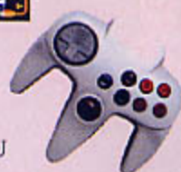
0812 CONSOLE DE JEU PING PONG VIRTUEL Jeu interactif sans fil à brancher sur la télévision pour jouer seul contre l'ordinateur ou à deux