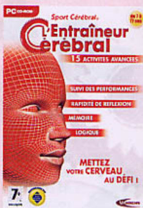
0957 CD ROM SPORT CÉRÉBRAL Entraîneur cérébral et torture cérébrale, 50 activités pour entraîner son cerveau.