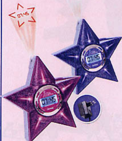
0966 RADIO RÉVEIL STAR AC Projection de l'heure sous la forme de l'étoile Star Academy ! Affichage LCD, fonctions radio et alarme. Livré avec un adaptateur secteur.