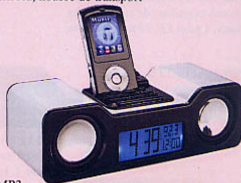
1270 STATION D'ACCUEIL MP3 ACCESSOIRES LECTEURS Avec radio réveil FM stéréo à affichage digital et recherche automatique des fréquences.