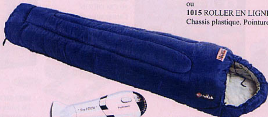
1078 SAC DE COUCHAGE CAGOULE Forme momie, cagoule rétractable, pied rond, poche intérieure, bourrelet antifroid, housse de transport