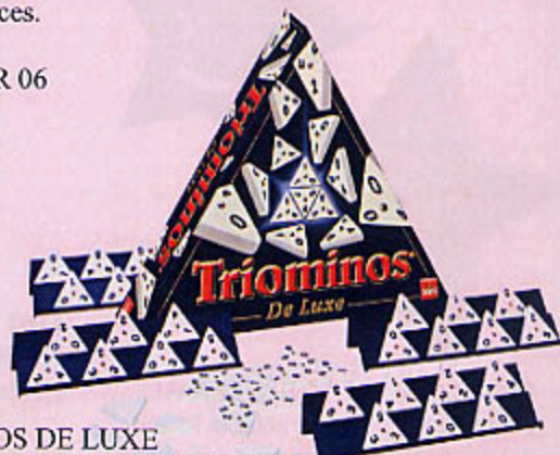
0887 TRIOMINOS DE LUXE Ce grand classique reprend le principe des dominos mais avec des pièces triangulaires ! Il vous faudra faire preuve de réflexion et de logique.