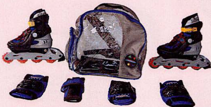
966 KIT ROLLER EXTENSIBLE 33/37 Avec sac et protections.