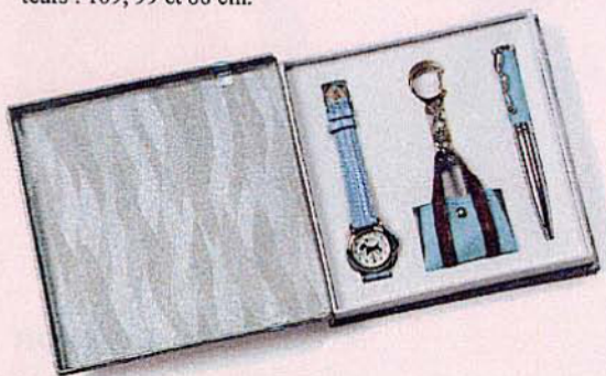
1056 SET MONTRE TERRIER Montre analogique + porte-clé sac + stylo.