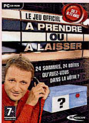
923 CD À PRENDRE OU À LAISSER Le jeu officiel de TF1.