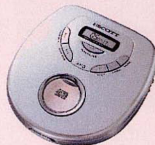
1086 LECTEUR CD PORTABLE Compatible CD-R et CD-RW, casque et adaptateur secteur. Piles : 2 R6 non fournies.