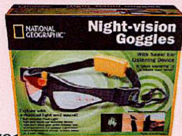
781 COFFRET NIGHT VISION GOGGLE Lunettes d'exploration nocturne avec appareil d'écoute et lumière intégrés. Piles non incluses.