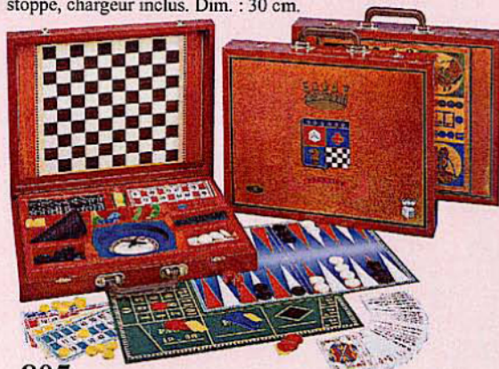
805 MALLETTE JEUX PRESTIGE Mallette avec jeux de roulette, backgammon, dames, dadas, oie, dominos, jeu de 54 cartes, loto, règles de jeux.