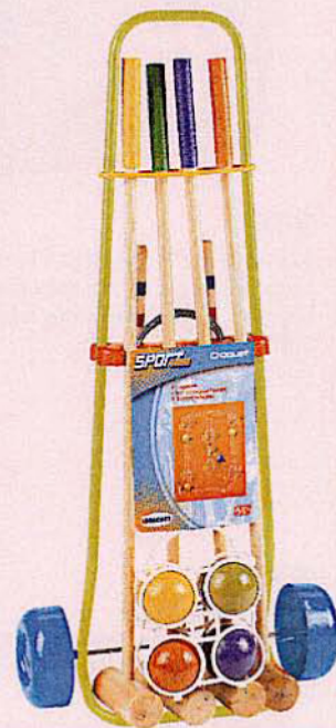
957 JEUX DE CROQUET 4 JOUEURS Boules et cannes bois + accessoires.