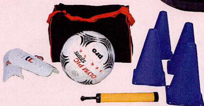
998 SAC À DOS FOOTBALL Rouge et noir. Complet avec ballon de foot, gants, protections, 4 cônes, pompe et sac de rangement.