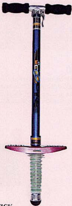
988 POGO-STICK En aluminium, réglable sur 3 hauteurs : 109, 99 et 88 cm.