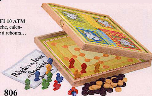
806 COFFRET BOIS 50 RÈGLES Petits chevaux, oie, dames, marelle, yams, 421, pions en bois, livret de 50 règles de jeux.