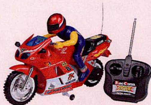
676 MOTO PANTHER Radioguidée avec chargeur, avance, recule, tourne gauche et droite, stoppe, chargeur inclus. Dim. : 30 cm.