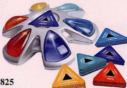
825 PREM'S Le célèbre jeu du baccalauréat en version électronique. 2 à 6 joueurs 3 piles LR06 non fournies.