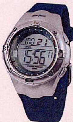
1048 MONTRE SPORT F1 10 ATM Rétro-éclairage, étanche, calendrier, alarme, compte à rebours...