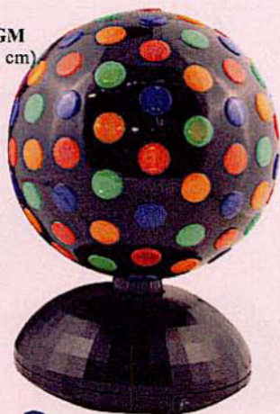
926 BOULE LUMINEUSE GM Grand modèle (hauteur 33 cm) Alimentation secteur.