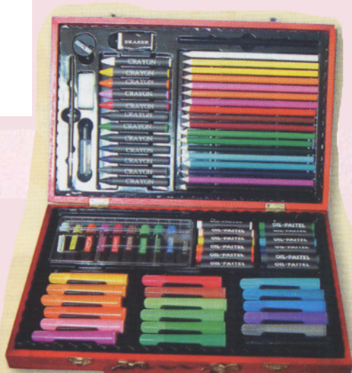
1084 MALLETTE DESSIN ET PEINTURE 77 Pièces