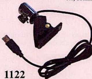
1122 WEBCAM USB Capteur couleur CMOS 30 000 Pixels éclairage intégré 6 LEDS, support pince orientable. Windows 98/1000/ME/XP. Jusqu'à 30 images seconde.