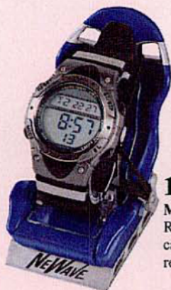
1050 MONTRE SPORT 10 ATM Rétro-éclairage, étanche, calendrier, alarme, compte à rebours...