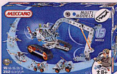
756 MECCANO 15 MODÈLES 252 pièces pour réaliser le modèle de ton choix