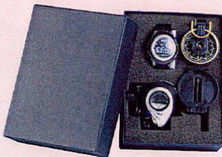
1061 SET BAROUDEUR Montre digitale + chronomètre + boussole.