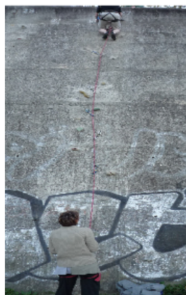
Action directe 4 sup