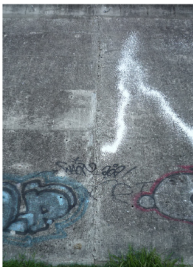
Céleste infusion 6a

Nom donné à la première voie du mur ouverte en 1984 par Eric Demay . Un 6a technique qui a servi de référence pour les autres cotations. La voie est cotée 6b+ sans prendre les trous d'évacuation d'eau c'est à dire en restant sagement dans la fissure. Les autres voies de droite ouvertes dans la foulée sont bien plus dures.